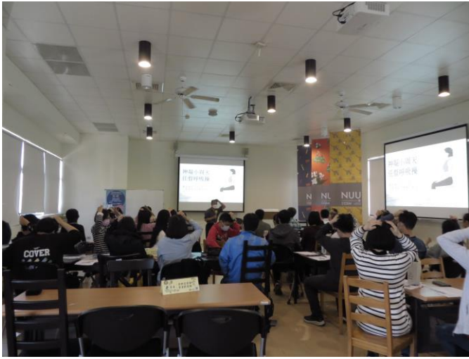
努力找穴位的學員們