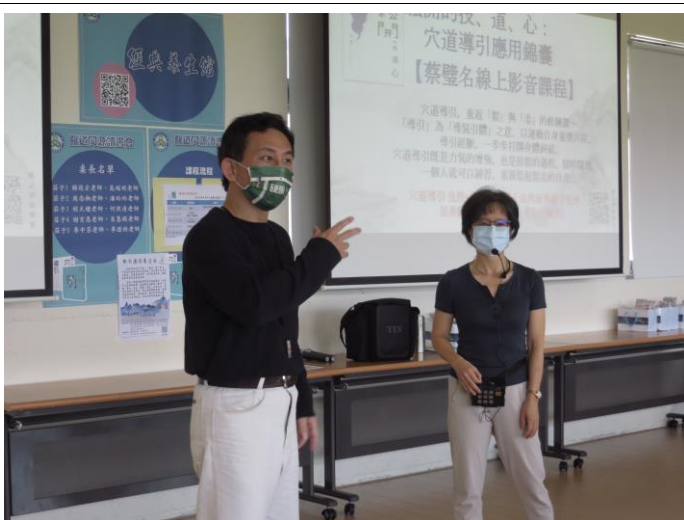
前院長介紹功法老師